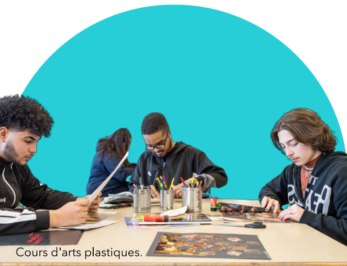
Cours d'arts plastiques.

Si vous avez un cours le matin, la période de consolidation qui suit est obligatoire et passe avant tout autre chose (même une convocation d'un autre enseignant). Vous pouvez quitter la période de consolidation lorsque votre enseignant vous en donne la permission seulement.